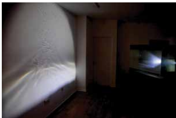
4. MOC Waterdive exposé à la gv-art gallery, Tondeur & Chomaz, (Photo JMC)