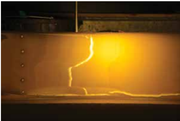
2. Machine reproduisant la rupture de la Pangée, Tondeur & Chomaz, 2014