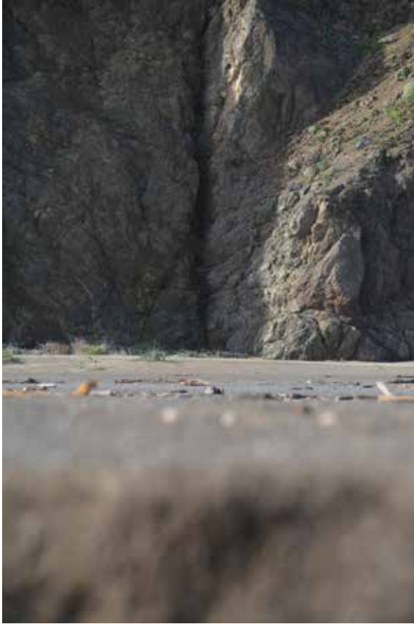
1. Point Arena, point le plus au nord où la faille de San Andrea rejoint l'océan