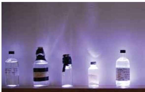
3. The Fathoms phials , la mémoire de l'océanographe, collection d'eau du point le plus profond de différentes campagnes océanographiques donation du Professeur Harry Bryden